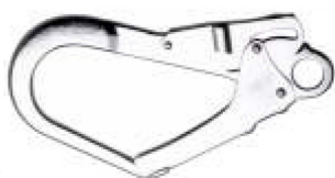
Conector C Modelo AA 022