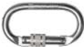
Conector B Modelo AA 011