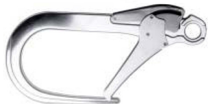
Conector D Modelo AA 024