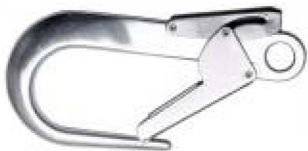
Conector A Modelo AA 023