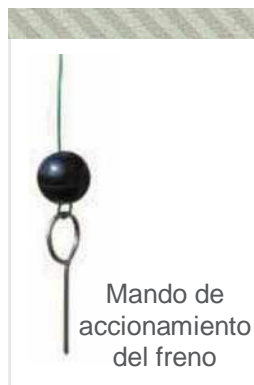
Mando de accionamiento del freno