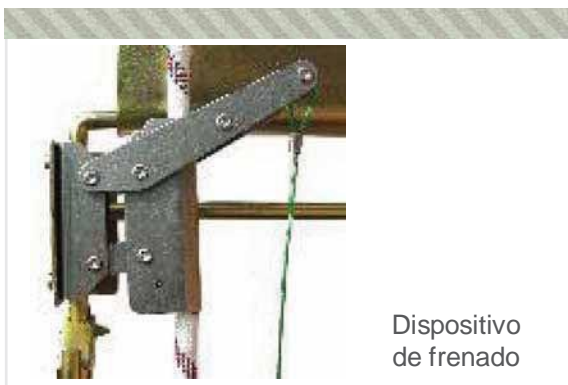
Dispositivo de frenado