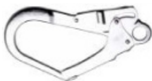
Conector 3 Modelo AA 022