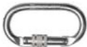
Conector 1 Modelo AA 011