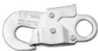
Conector 2 Modelo AA 002