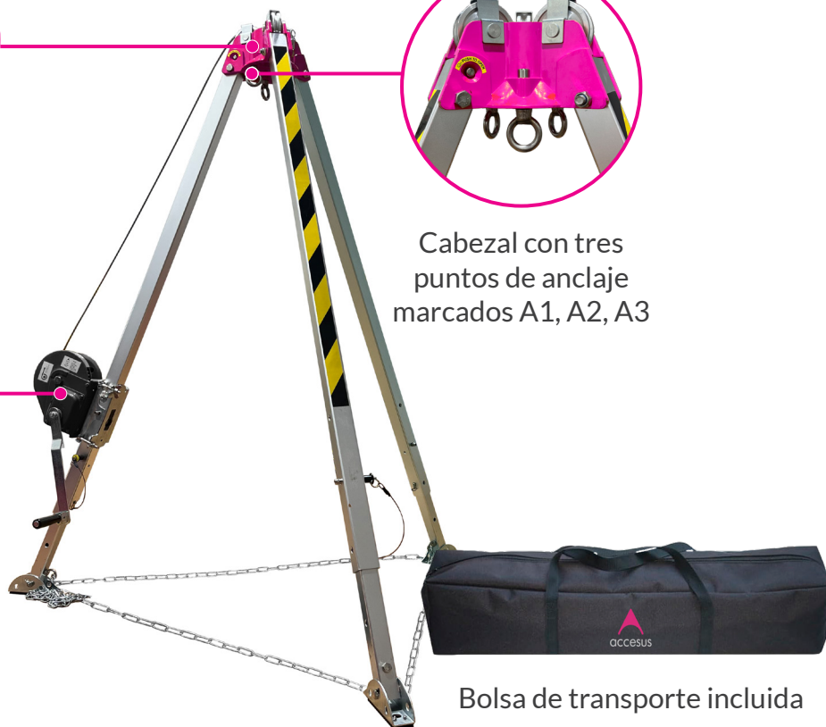
Bolsa de transporte incluida