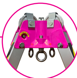
Cabezal con tres puntos de anclaje marcados A1, A2, A3